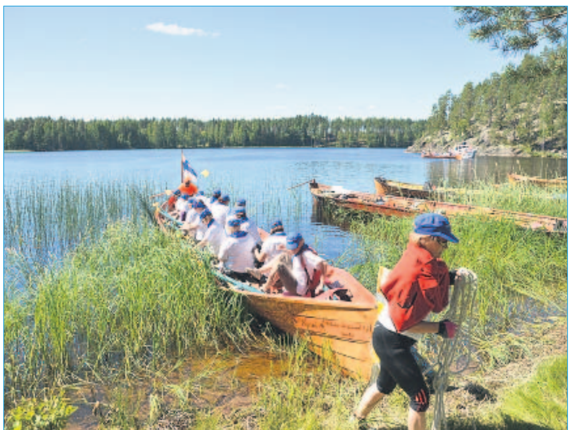
RANTAUTUMINEN VARMAVIRRALLE. Maanpuolustusnaiset Imatralta rantautumassa Varmavirran kahvipaikan rantaan torstai-iltapäivänä.

– Sihteerien osalta soudut menivät työn touhussa ilman suurempia ongelmia. Viikonloppu oli kiireinen, mutta yhdessä kokeneiden