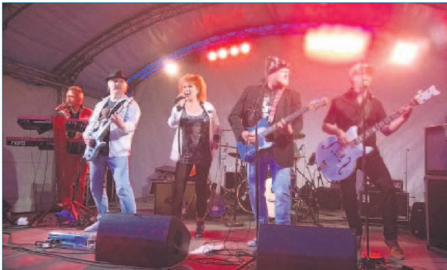
MEININKI KOHDALLAAN. Lauantai-iltana soutustadionin jättiläisöä viihdytti Vicky Rosti & Toyboys. Illan aikana kuultiin vanhoja hittejä vuoden 1987 Euroviisuedustajan omasta tuotannosta sekä muutama hieno coverbiisi muun muassa Haloo Helsingiltä. Encoreen säästetty hitti "Sata salamaa" villitsi yleisöstä suurimmat suosionsoitukset.

– Ja vaikka stadionilla oli etenkin lauantaina paljon porukkaa, järjestyksenvalvojat pystyivät pi-