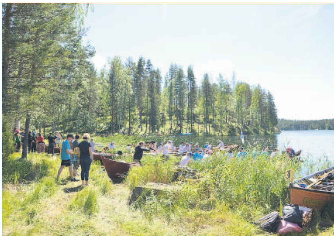
HYVÄÄ HUOLTA. Retkisoutajien taukopaikka Varmaviralla alkoi täyttyä torstaina iltapäivällä. Soutajista pidetään hyvää huolta.